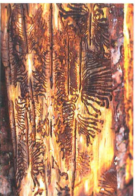
Rozvinutý požerok lýkožrouta smrkového

dospělých smrků s výjimkou jejich vrcholku (nejčastěji od stáří 60 let, výjimečně i mladších). Jeho vývoj trvá obvykle 6 – 10 týdnů, v závislosti na teplotě.