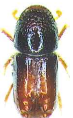
Dospělec lýkožrouta lesklého

Lýkožrout lesklý (cca 2 mm) se vyvíjí pod kůrou větví starých smrků, ve vrcholové části koruny nebo na mladých stromcích; na kmeni dospělých smrků ve střední a spodní části se vyskytuje méně často. Vývoj trvá 6 – 10 týdnů.