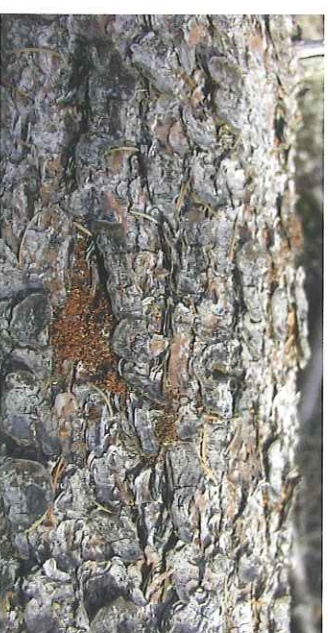
Drtinky na ležícím kmenu