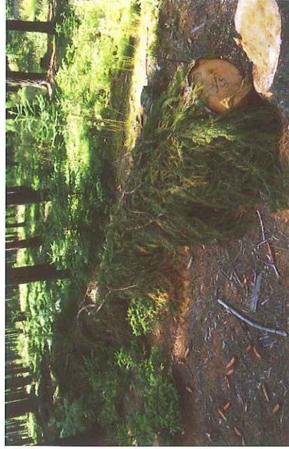
Lapák zakrytý větvemi

Lapák je pokácený a odvětrý strom, podložený (aby brouci mohli využít celou plochu kmene) a zpravidla zakrytý větvemi (zpomalení vysychání kůry). Kácí se před předpokládaným začátkem rojení, tj. zpravidla do konce března. Lapáky se musí kontrolovat, a to především z důvodu jejich obsazení, aby bylo možné včas přikácet další lapáky. Ty se přikácují, je-li lapák plně obsazen (cca 1 závrt na 1 dm 2 v nejhustější napadené části kmene). Současně se kontroluje vývoj lýkožroutů, aby bylo možné lapáky včas asanovat.