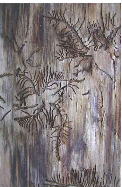
Požerok lýkožrouta lesklého