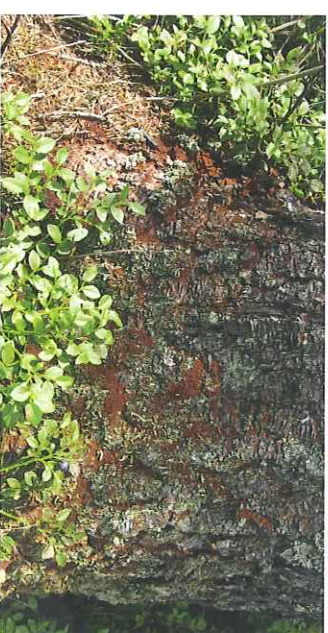
Drtinky na patě stojícího stromu

Na stojících stromech je prvním symptomen přítomnost drtinek na patě kmene. Na kmeni se objevují závrtty, doprovázené často výrony pryskyřice (pozor: v případě oslabení suchem k tomuto smolení často nedochází). Posléze dochází k barevným změnám jehličí, které postupně rezne a opadává. Dochází také k opadávání kůry, napřed na malých ploškách, později prakticky na celém kmeni. Napadené stromy již neze zachránit, je nutné je urychleně pokácet a následně asanovat. Na ležících stromech se nacházejí závrttové otvory, vedle kterých se objevují hromádky rezavých drtinek.